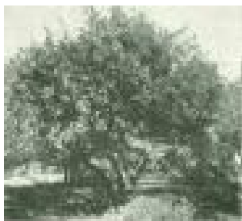
Modertræet af Filippa. Foto 1937.

Formen er meget foranderlig, næppe to Frugter er ens. Kan være rundagtige, men ogsaa lange og nærmest valseformede; er ofte skæve. Bugen sidder under eller paa Midten. Mod Stilken er Frugten flad. Den er kantet, især hen mod Bægeret. Pænt Æble, der dog ved sin Forskellighed i Form og Farve virker noget uroligt. Giver mange Sorteringer.