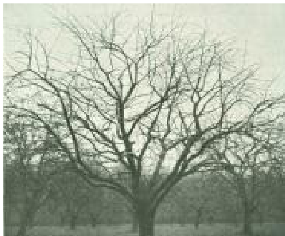
Filippa. 40-aarigt Træ i GI. Hestehauge ved Svendborg, 7 m højt og 8 m bredt.

Filippa er en meget haardfør og let dyrkelig Sort med en Række andre gode Egenskaber, men den har ogsaa en Del Fejl. Til Erhvervsfrugtavl kan den næppe anbefales; derimod til Frugtavl som Bierhverv, og det er vel ogsaa fra den Slags Plantninger, det meste af Handelsfrugten af denne Sort fremkommer. Til Privathaver kan den anbefales til Plantning overalt, især under vanskelige Forhold og i Jylland, men vel at mærke kun, hvor der er godt Læ og fornøden Plads. Til Espaliering egner denne Sort sig slet ikke. — I Barkfarve og Grenbygning ligner Filippa Irsk Ferskenæble saa meget, at man fristes til at gætte paa, at sidstnævnte er Modersorten.