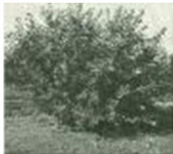
5-årigt Træ på »Søborg«, Glud.

kanariegul Tone med hvidligt Skær. De fleste Frugter er uden Dækfarve, enkelte har lidt orange på Solsiden. Huden med Vokslag, senere lidt fedtet. Over hele Frugten findes talrige og iøjnefaldende Hudpunkter, der i Farve skifter fra mørkegrønt til gråbrunt, omgivet af en lysere Kreds og på Solsiden undertiden af orange.